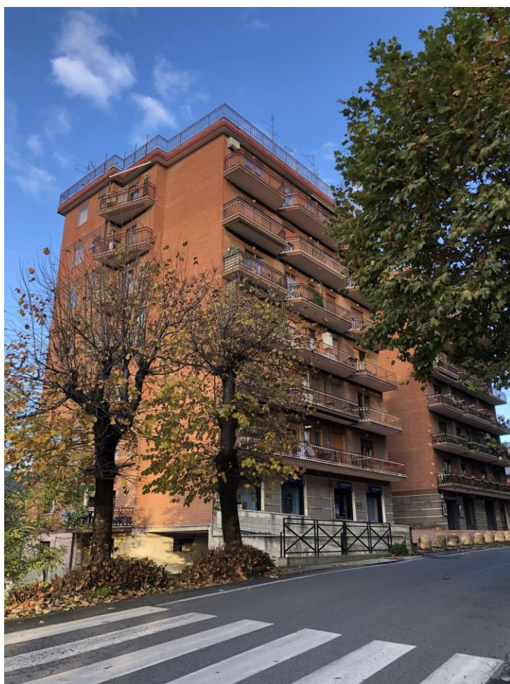
VISTA ESTERNA DEL FABBRICATO LOTTO UNICO: Comune di Ferentino - Fg. 22, part. 355, subb. 16-57